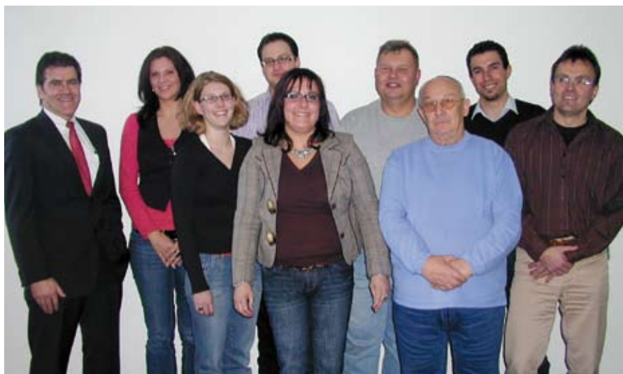
Ehrenamtlich engagierte Mitarbeiter in Möhlin

Streck Transport unterstützt 17 Mitarbeiter in Deutschland und der Schweiz mit insgesamt 10.000 EUR in ihrer täglichen Arbeit oder für ganz konkrete Projekte. Aufgrund der positiven Resonanz und des vielfältigen Engagements der Mitarbeiter soll die Aktion auch im kommenden Jahr wiederholt werden.