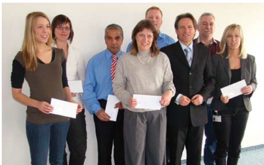
Ehrenamtlich engagierte Mitarbeiter in Freiburg